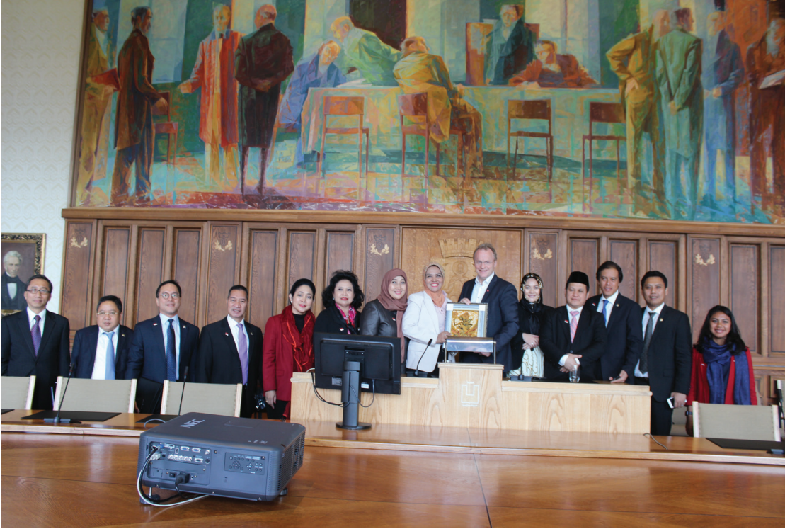
Pertemuan delegasi Panja SDGs DPR-RI dengan Governing Mayor of Oslo, Mr. Raymond Johansen