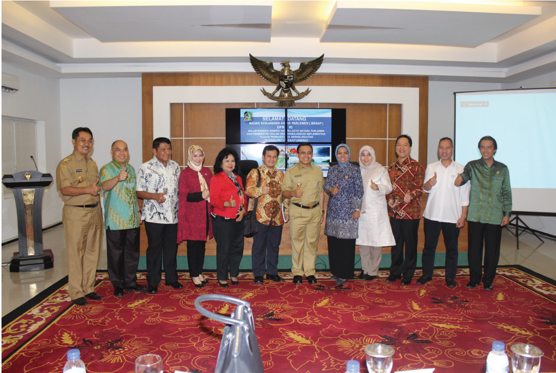
Pertemuan dengan Bupati Banyuwangi beserta jajarannya di Kantor Bupati Banyuwangi