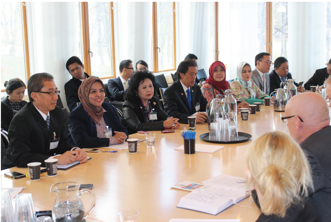
Pertemuan Delegasi Panja SDGs DPR-RI dengan Kementerian Luar Negeri Norwegia