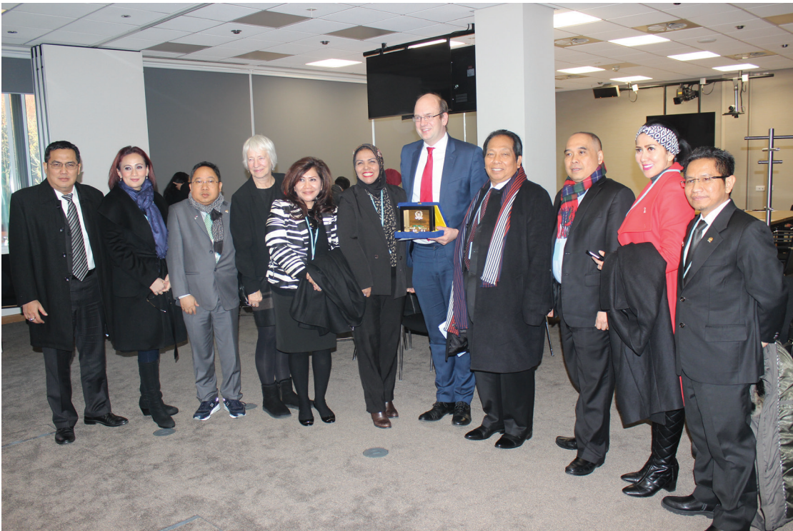
Pertemuan dengan Climate Change, environmental and rural affairs committee, Government of Wales

Pada 2009, Pemerintah Wales mengeluarkan One Wales: One Planet yang merupakan skema pembangunan berkelanjutan yang dicanangkan oleh Pemerintah Wales. Buku ini berisi penegasan pembangunan berkelanjutan sebagai tujuan strategis yang menyeluruh dari semua kebijakan dan program lintas portofolio semua kementerian.