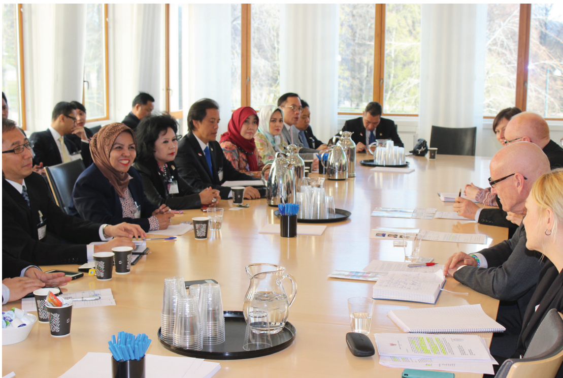
Pertemuan dengan Komisi Lingkungan Parlemen Norwegia

Sesuai dengan bab 2 dari undang-undang mengenai informasi lingkungan, informasi lingkungan yang wajib dipublikasikan adalah informasi analisis dampak lingkungan, kondisi kesehatan dan keselamatan manusia yang dapat dipengaruhi oleh perubahan lingkungan dan juga rencana program yang dapat memulihkan lingkungan tersebut. Undang-undang ini juga memperluas persyaratan kepada pihak swasta untuk membuka informasi dampak lingkungan di dalam proses produksi dan juga konten produk impor terhadap lingkungan.