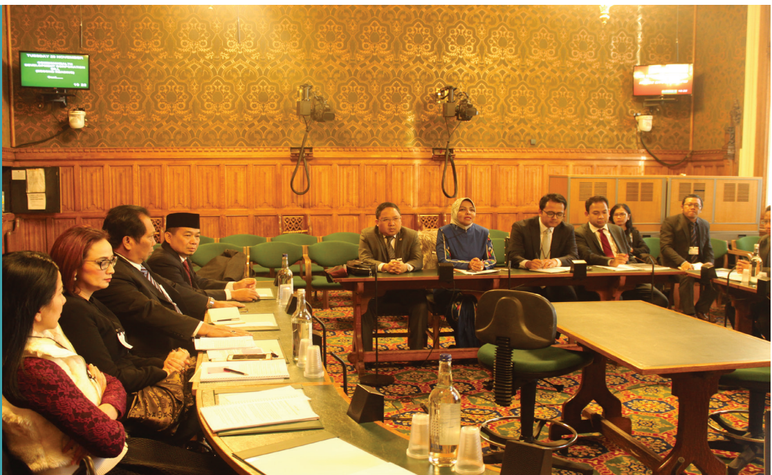
Pertemuan dengan Komite Audit Parlemen Inggris Raya

Pascakeluarannya UK dari Uni Eropa, penurunan nilai mata uang poundsterling atau yang dikenal dengan istilah " sterling downward " menjadi tren yang mengkhawatirkan prospek pertumbuhan ekonomi UK. Perdebatan ekonomi yang meramalkan masa depan ekonomi UK menjadi menu perdebatan sehari-hari di UK ketika anggota Panitia Kerja Tujuan Pembangunan Berkelanjutan (TPB) mengadakan kunjungan teknis ke London pada 27 November-3 Desember 2016. Perkembangan ekonomi yang demikian menimbulkan sejumlah dampak terutama pada komitmen UK yang mengalokasikan 0,7 % dari Gross National Income (GNI) untuk program bantuan internasional (ODA).