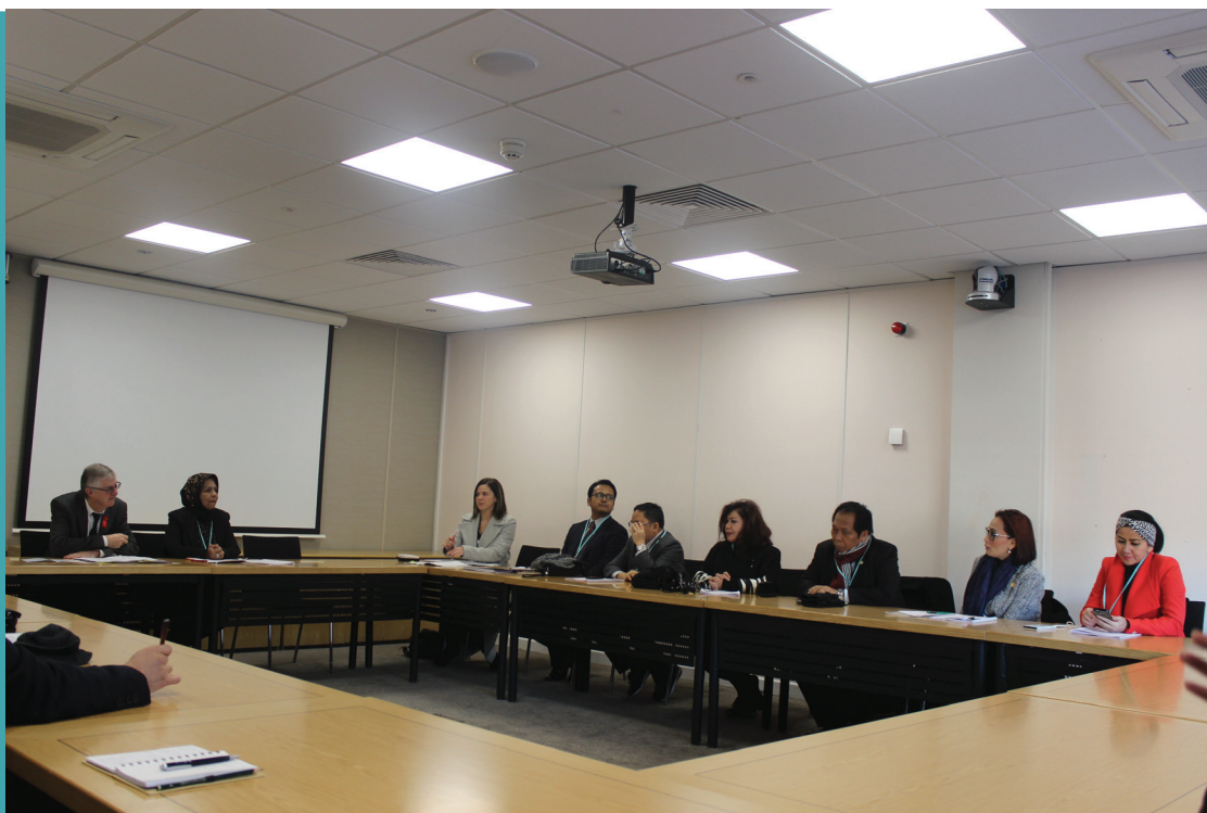
Anggota Panja SDGs bertemu dengan First Minister Government of Wales

UK menunjukkan komitmen global terhadap perubahan iklim (goal 13). Pada 2015 UK meningkatkan pendanaan iklim setidaknya 50% selama lima tahun (2016-2020), termasuk menghabiskan setidaknya GBP 1,76 miliar di 2020, naik menjadi setidaknya GBP 5,8 miliar selama lima tahun. Ini menunjukkan komitmen Inggris untuk membantu negara-negara berkembang menggunakan energi bersih dan membangun ketahanan terhadap dampak perubahan iklim, menjelang konferensi perubahan iklim penting Desember di Paris.