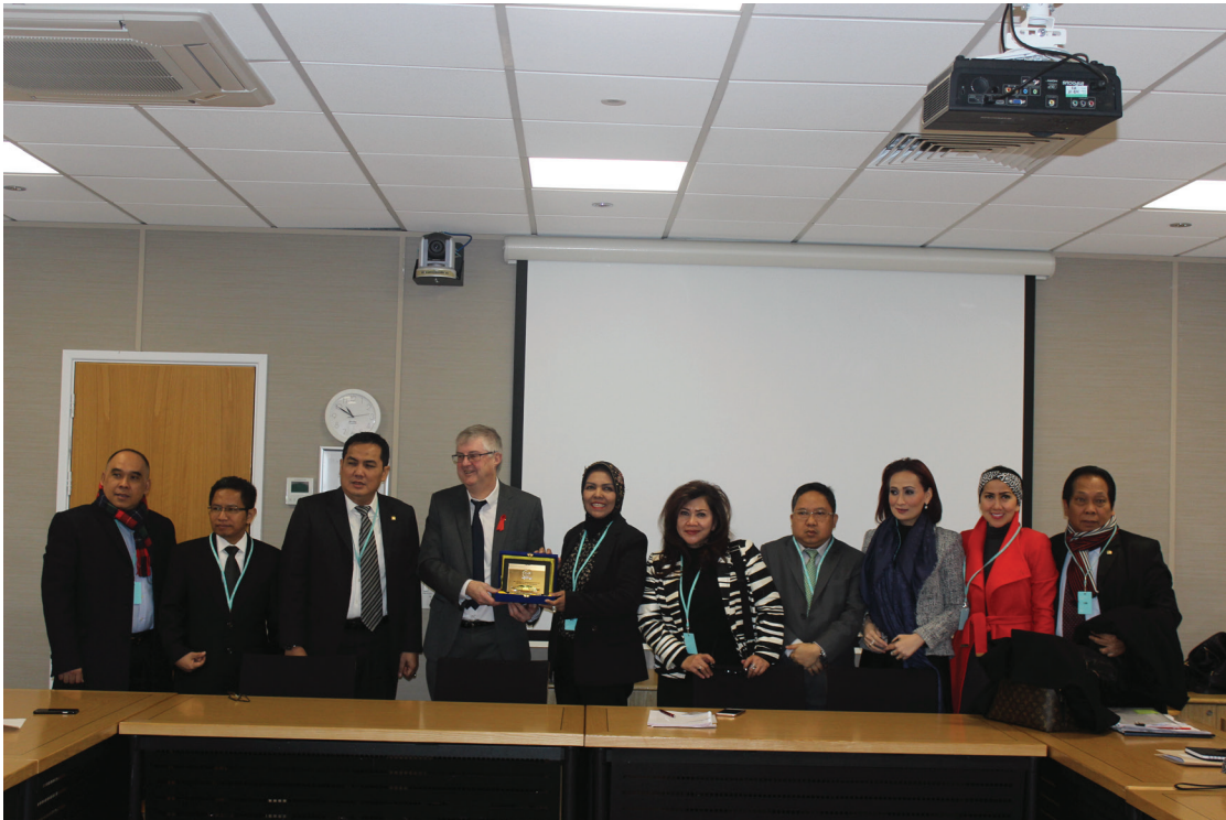
Foto bersama delegasi Panja SDGs DPR-RI dengan Chairman of the Cabinet Secretary for Finance and Local Government First Minister Wales