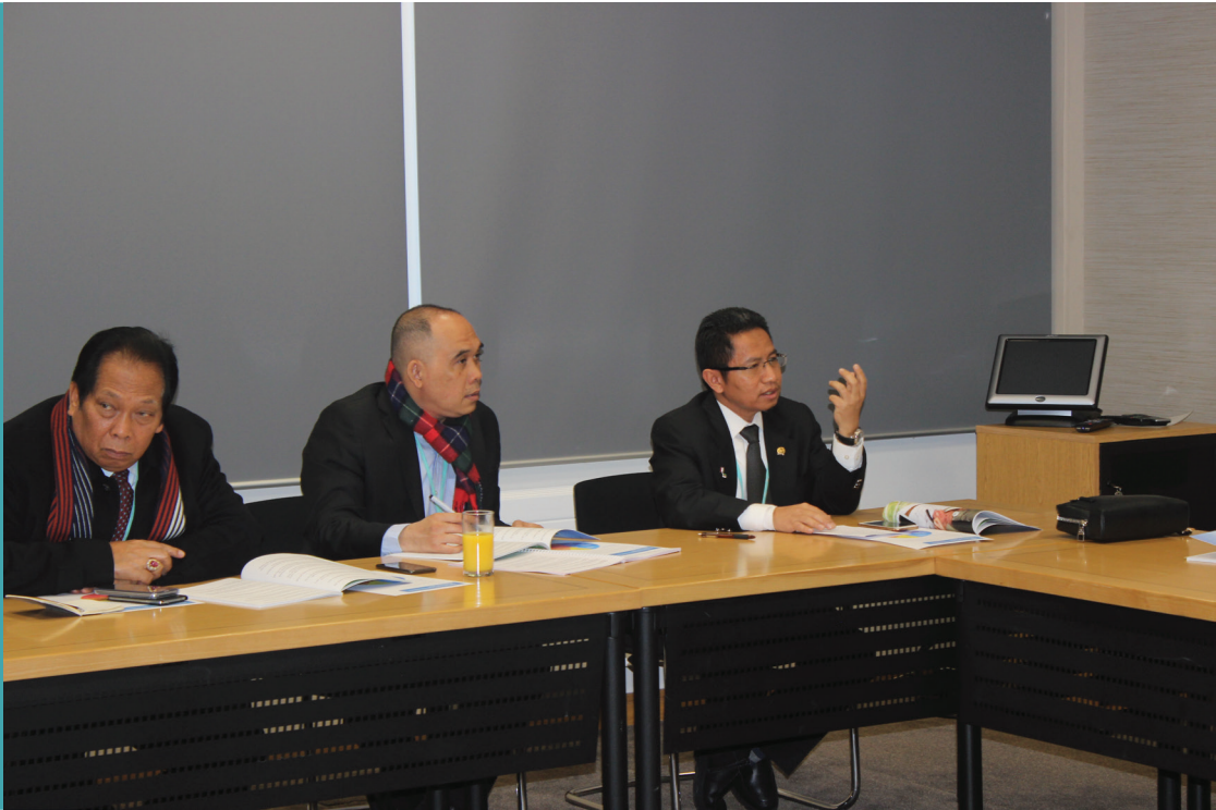
Foto Bersama dengan Chairman of Climate change, environment and rural affairs committee, National Assembly Of Wales