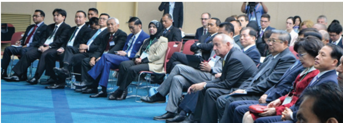
Ketua BKSAP, Dr. Nurhayati Ali Assegaf, M.Si, bersama Delegasi DPRRI lainnya sedang mengikuti presentasi dari President of the Global Green Growth Institute (GGGI), Dr. Susilo Bambang Yudhoyono, pada CGGI Summit pada tanggal 5-9 September 2016 di Jeju - Korea Selatan.

Pada September 2016, Panja SDGs mendapat kehormatan diundang oleh Global Green Growth Institute (GGGI) untuk mengikuti Summit yang digelar di Korea Selatan. GGGI Summit kali ini fokus pada tema Towards a Green Finance Action Agenda 2017 . Ketua Panja SDGs, Dr Nurhayati Ali Assegaf mengikuti agenda tersebut dan menyerukan pelibatan parlemen dalam kerja-kerja GGGI untuk mencapai SDGs. Terlebih, SDGs menekankan keterlibatan seluruh pemangku kepentingan dalam kesuksesan pencapaian agenda pembangunan global tersebut.