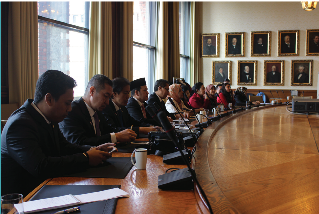
Pertemuan dengan Governor of Oslo

beberapa kementerian yang terkait dibutuhkan. Setiap kementerian wajib mengidentifikasi daftar target yang dianggap menantang bagi Norwegia dan juga melaporkan status tindak lanjut dari masing-masing tujuan. Hasil dari laporan tersebut kemudian disalurkan kepada Kementerian Keuangan yang bertugas dalam menyimpulkan poin-poin utama pencapaian dan tantangan secara keseluruhan yang kemudian akan dituangkan ke dalam anggaran nasional Norwegia dan disampaikan kepada Stortinget . Kemudian Kementerian Luar Negeri memiliki tanggung jawab untuk menyusun dan menyajikan laporan secara keseluruhan dengan melibatkan para pemangku kepentingan lainnya seperti sektor bisnis, masyarakat sipil dan juga Sami Parlemen melalui konsultasi informal, sebelum proses tersebut diteruskan kepada High Level Political Forum di PBB. Melalui mekanisme yang telah disepakati tersebut, Norwegia telah berhasil menyampaikan national voluntary review yang pertama kepada HLPF pada tahun 2016 yang lalu.