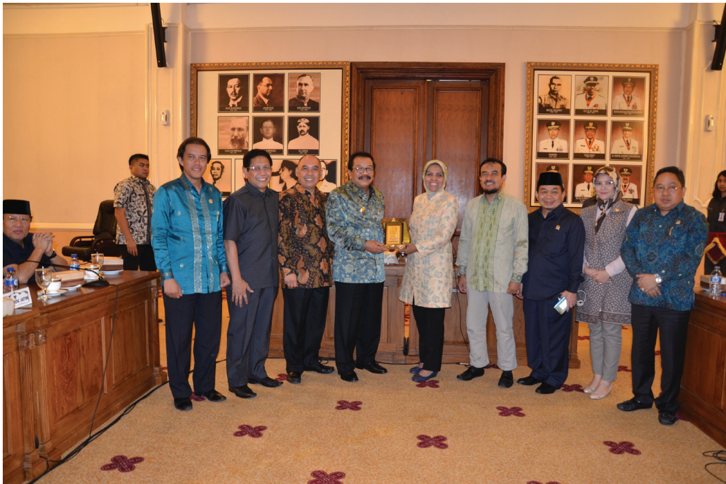
Pertemuan dengan Gubernur Jawa Timur

bertambahnya pendapatan dari sumber daya laut dan ikan. Kelompok Samudera Bakti telah secara kontinyu mengadakan pertemuan dan pembinaan bersama-sama Universitas, Lanal dan juga Pertamina kepada masyarakat dan nelayan untuk selalu melestarikan dan memulihkan lingkungan hidup khususnya laut dengan program transplan karang yang murah dan mudah.