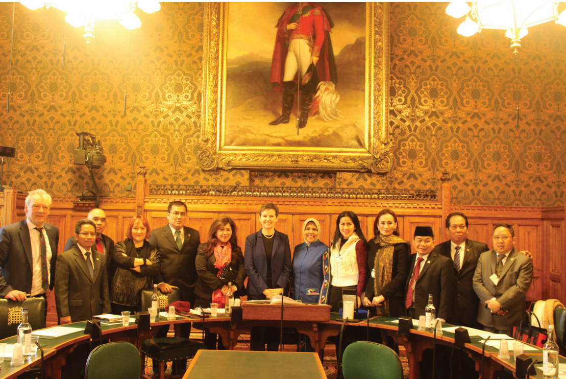
Foto bersama delegasi Panja DPR-RI dengan Ketua Environmental Audit Committee Parlemen UK