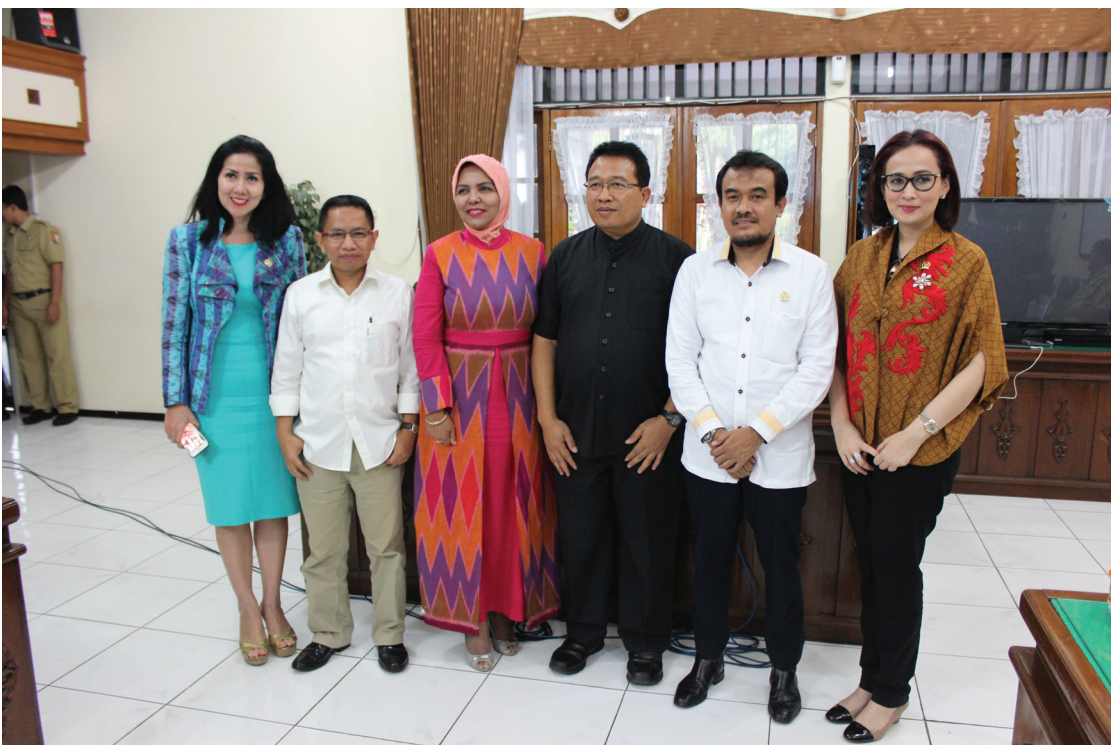
Foto Bersama anggota Panja SDGs BKSAP DPR-RI dengan bupati Bojonegoro