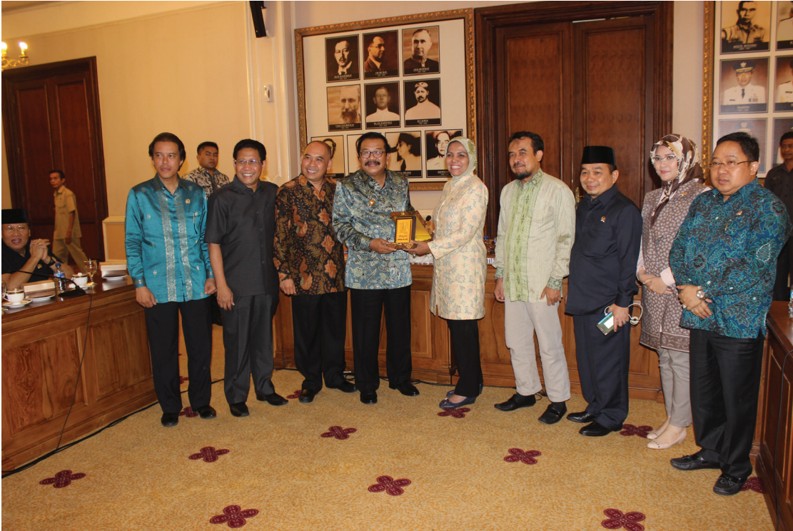
Foto bersama dengan Gubernur Jawa Timur beserta jajarannya di Kantor gubernur Jawa Timur