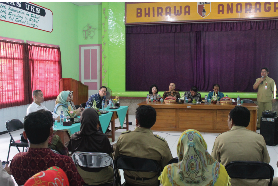
Peninjauan ke SD Unggulan Brawijaya di Banyuwangi yang memiliki program beasiswa asuh sebaya