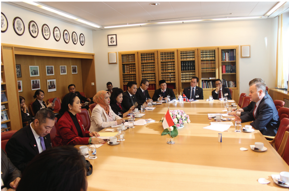
Pertemuan delegasi Panja SDGs dengan Ketua Parlemen Norwegia

Setelah disahkannya Sustainable Development Goals pada bulan September 2015 yang lalu, diskursus mengenai pembangunan berkelanjutan di dalam Parlemen Norwegia ( Stortinget ) terus mendapatkan perhatian secara nasional. Salah satu hal yang pernah menjadi perdebatan di dalam parlemen adalah visi dan misi Norwegia untuk mendukung kebijakan pemberantasan kemiskinan di negara-negara miskin dan rentan yang ada di dunia sebagai prioritas utama keseluruhan dari Norwegia. Hal ini mendapatkan dukungan yang kuat oleh setiap konstituen yang di wakili oleh Storting .