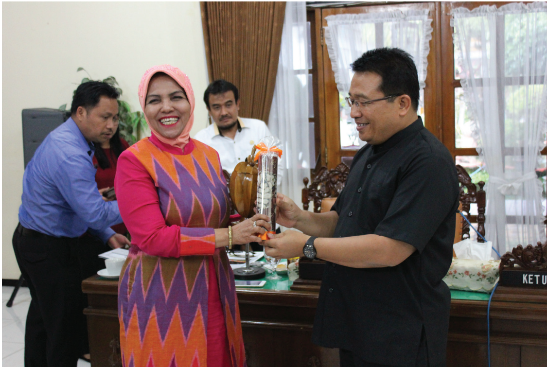
Penyerahan cinderamata oleh Bupati Bojonegoro

sederajat sebesar Rp.2.000.000,-/tahun. Selain itu program pengurangan angka kemiskinan juga dibantu oleh peningkatan perekonomian pedesaan yang memiliki tujuan peningkatan industry padat modal dan padat karya. Keseluruhan strategi di dalam konsep awal Rencana Aksi Daerah teridentifikasi melalui penggunaan open data.