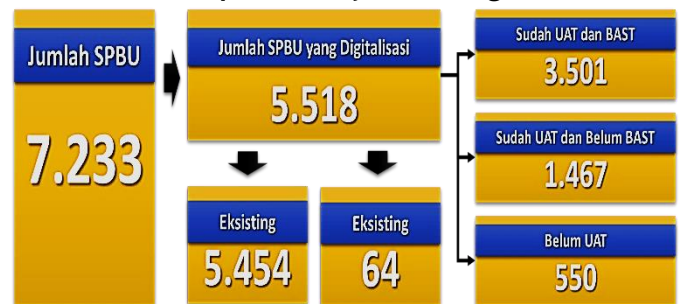
Gambar 2. Rekapitulasi Penyelesaian Digitalisasi SPBU

Berdasarkan Data Rekapitulasi Penyelesaian Digitalisasi SPBU per 31 Desember 2020 oleh BPK RI, diketahui sebanyak 3.501 SPBU telah melakukan uji coba operasional atau User Acceptance Test (UAT) dan juga telah memiliki Berita Acara Serah Terima (BAST), sebanyak 1.467 SPBU sudah melakukan User Acceptance Test (UAT) namun belum dilakukan Berita Acara Serah Terima (BAST), dan sisanya sebanyak 550 SPBU belum melakukan User Acceptance Test (UAT) atau belum selesai. Lebih lanjut, data tersebut dapat di lihat pada gambar di atas (BPK RI, 2021).