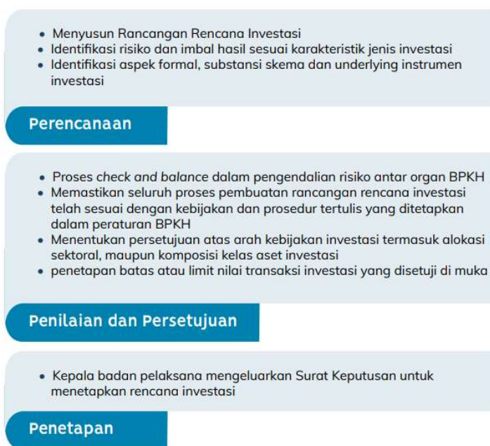
Gambar 1. Proses Mitigasi Risiko BPKH

Berdasarkan telaah di atas, dapat disimpulkan bahwa BPKH selama ini telah mengelola keuangan haji dengan sangat hati-hati untuk memitigasi risiko agar tidak mengalami kerugian yang diatur dalam Peraturan BPKH Nomor 5 Tahun 2018 tentang Tata cara dan Bentuk Investasi Keuangan Haji (Peraturan BPKH 5/2018). Berikut ini upaya mitigasi risiko BPKH yang tergambar dalam gambar di bawah ini: 13